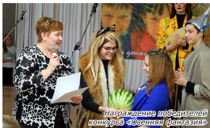
Награждение победителей конкурса «Осенняя фантазия»