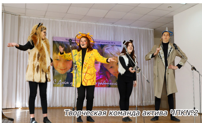
Творческая команда актива ЧПК№2