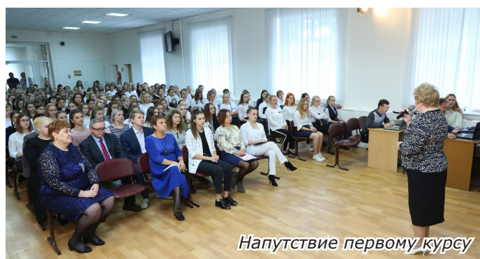
Напутствие первому курсу